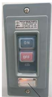
パイロットランプ点灯