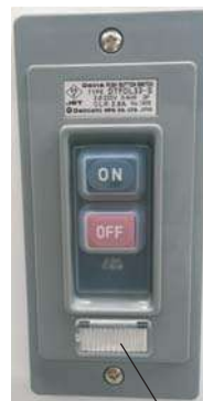
パイロットランプ消灯