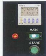
デジタルカウントダウンタイマー 残り時間が一目でわかります。

角度調整が可能な アルミ製セパレートバンク。 (個別スイッチ付) 照射面積は1200mm×1200mm。