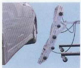
スプリングバランサー内蔵 ルーフからステップ乾燥まで ラクラク上下移動